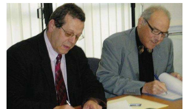
Signature de la convention de partenariat entre le CDG01 et le CNFPT

Une fois rédigé, le plan de formation sera soumis, pour avis, aux membres du CTP et présenté au Conseil d'administration du Centre de gestion.