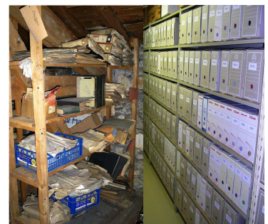
Avant intervention Après intervention

35 devis ont été réalisés pour 2010-2011 dont 24 devis acceptés à ce jour.